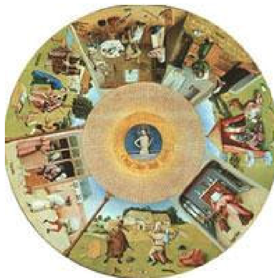
Hieronymus Bosch, I sette peccati capitali (1475-1480) Madrid, Museo del Prado.